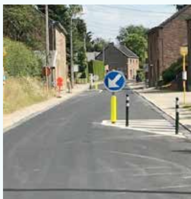
Rue Jean-Baptiste Loriaux