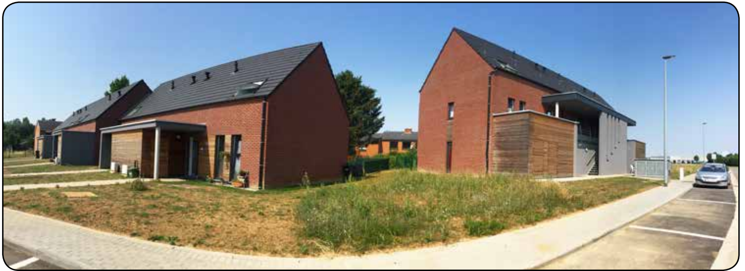
10 nouveaux logements publics à Frasnes-lez-Gosselies