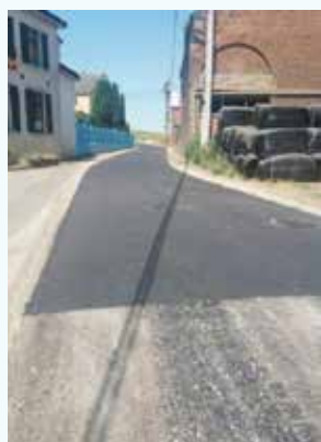
Rue Rèvioux à Rèves