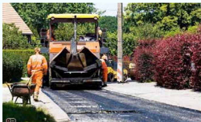
Rue du Calvaire à Villers-Perwin