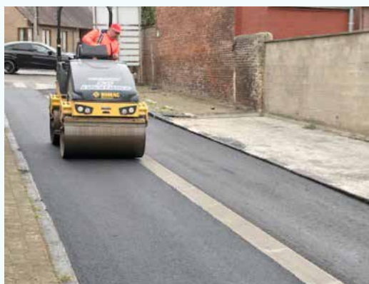
Rue Léopold III