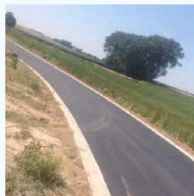
Chemin de la Tuilerie